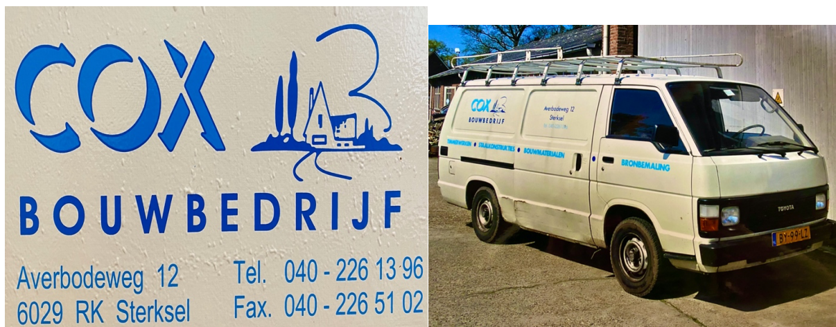
Logo bouwbedrijf Cox en de eerste bus