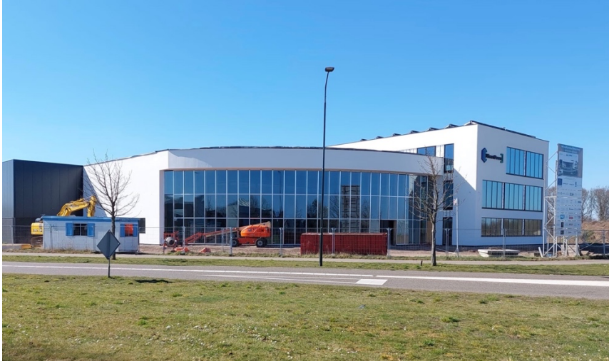
Industrieterrein Budel, gebouwd door bouwbedrijf Cox.

Bouwbedrijf Cox vond het verenigingsleven op Sterksel altijd erg belangrijk. Zij hebben in de loop van de jaren veel verenigingen, clubs en evenementen gesponsord.